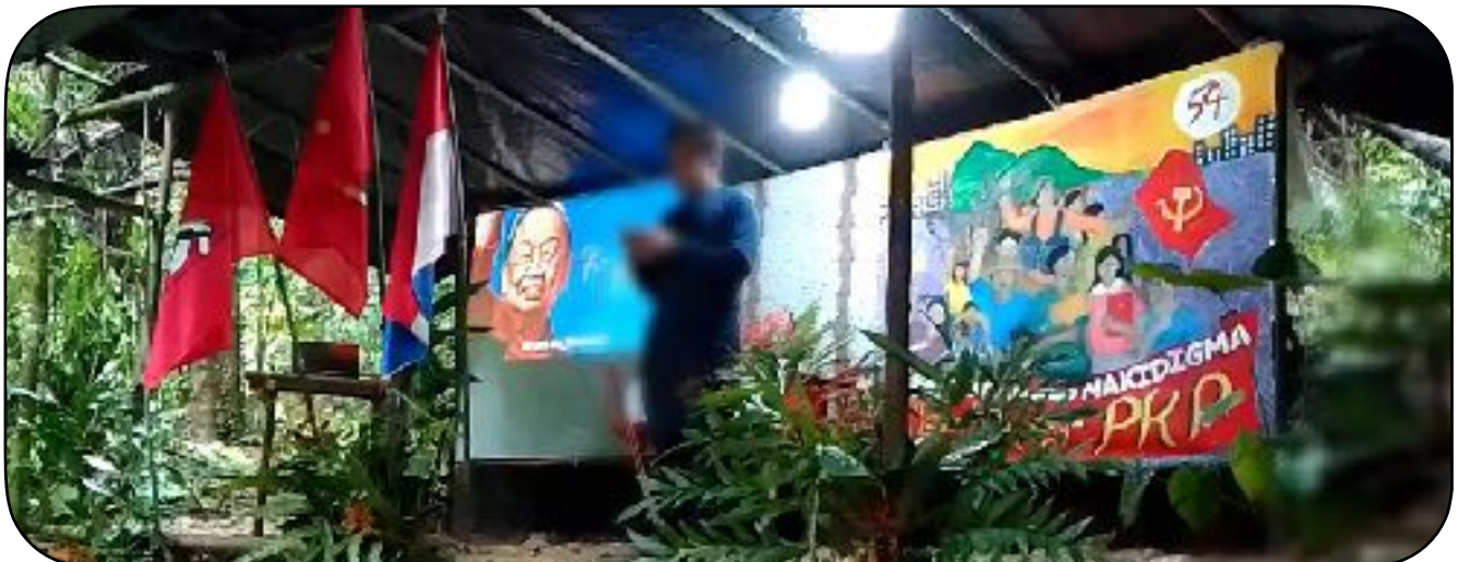
Programang-parangal ng mga kasama sa Blcol para kay Ka Joma

Hanggang sa maagang bahagi ng dekada 2000, gumampan siya ng nangungunang papel sa pagbubuo ng International Conference of Marxist-Leninist Parties and Organizations (ICMLPO) na nagsilbing sentro ng pagtutulungan sa ideolohiya at praktika sa hanay ng mga partidong komunista at manggagawa na nandindigan para sa sosyalismo at tumuligsa sa